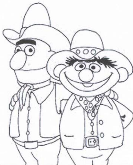
Epi y Blas en el rol de "Hermanos Malasombra"

Afortunadamente estos casos patéticos se aclaran por si solos, el público termina por darse cuenta de las manipulaciones y de los intereses que les mueven y a final de cuentas, quienes quedan mal definitivamente son esas personas que han intentado desvirtuar o descalificar injustamente a otras.